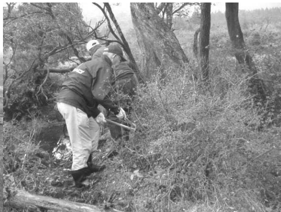
草刈り等除去作業