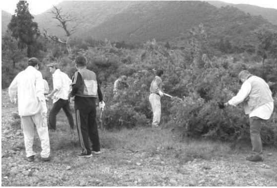
草刈り等除去作業